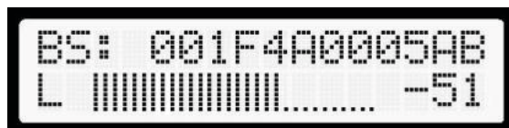
Ejemplos de interfaz del dispositivo